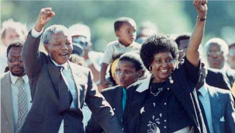
2 november 1990, Nelson Mandela loopt als vrij man de gevangenis uit]

Bij de combinatie 'Nelson Mandela' en 'bevrijding' denk je uiteraard aan dat bijzondere moment dat hij na 27 jaar gevangenschap om zijn overtuigingen, als vrij mens de gevangenis verlaat. Ik denk dat iedereen die dat bewust heeft meegemaakt dat beeld nooit meer zal vergeten. Wat een enorme hoop ging er uit van die gebeurtenis. Je voelde dat je een historisch moment meemaakte!