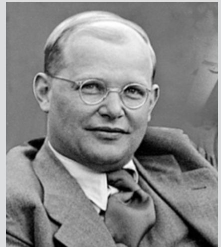
Dietrich Bonhoeffer 1906 – 1945

Maar dit ging bij Bonhoeffer altijd samen met het horizontale aspect van geloven: namelijk hoe je dat in het dagelijks leven gestalte geeft. Wat staat je te doen, in de politiek, in je eigen levensverbanden? Juist door een diepe doordinking van het verticale aspect van geloven kwam voor hem meer en meer vast te staan dat de manier waarop de gevestigde kerken in Duitsland dat horizontale aspect vorm gaven, niet de weg was die Christus wijst. Wat nodig was: een ondubbelzinnige afwijzing van de vergoddelijking van de mens (het fascisme) en een ondubbelzinnige oproep om de vervolging van joden te veroordelen. Zijn keuze om uiteindelijk in Duitsland