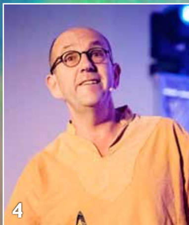
Vroom en vrolijk