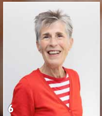
Overdracht van de voorzitterskamer