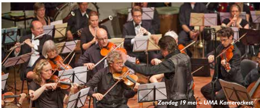
Zondag 19 mei – UMA Kamerorkest