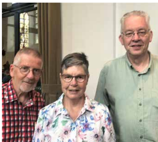
De zangers van het eerste uur