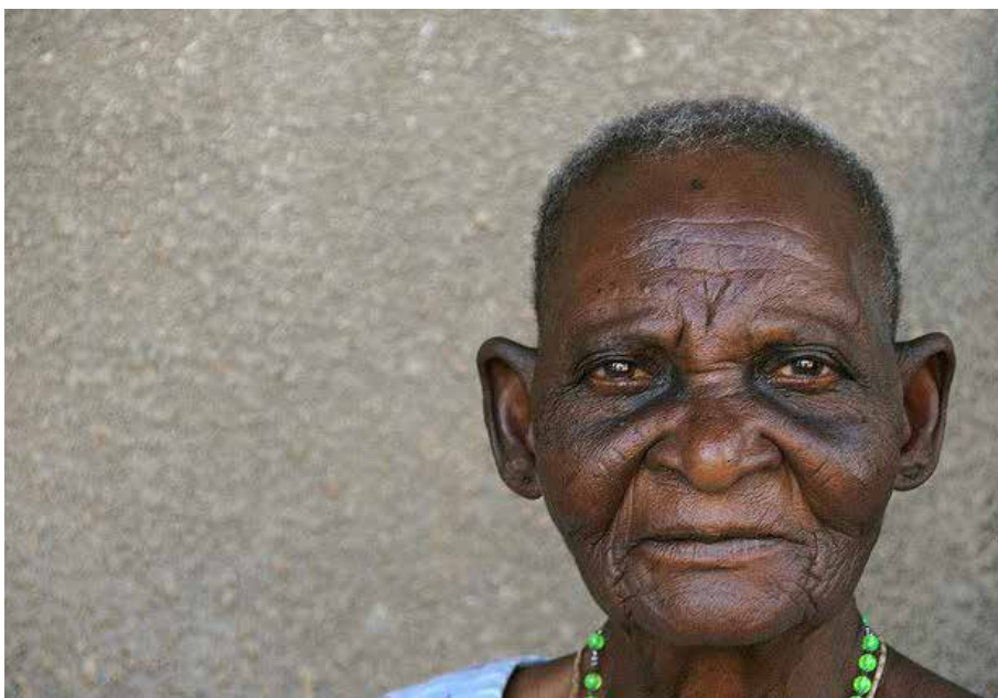
Project van de maand: Stichting Oud in Afrika

'Wat leuk om jullie te leren kennen' en 'Een hartverwarmende avond.' Twee reacties op de avond die we voor asielzoekers uit de noodopvang Zeist organiseerden. Op maandagavond 23 mei deelden we een maaltijd met hen. Het initiatief ontstond maanden geleden. Er was behoefte om iets praktisch te doen met de groeiende groep asielzoekers in Utrecht en omgeving. Een gezamenlijk diner zou de mogelijkheid geven elkaar te ontmoeten. De eerste poging mislukte vanwege een versnelde ontruiming van de noodopvang in Utrecht. Hierna kwam er een mogelijkheid met de bewoners van de noodopvang Zeist. Binnen een mum van tijd was het inschrijfformulier daar vol; met vijfendertig deelnemers uit Zeist en vijftien gegadigden uit de gemeente werd het een diner voor vijftig personen. De avond verliep soepel. De gasten werden door RGU-leden opgehaald