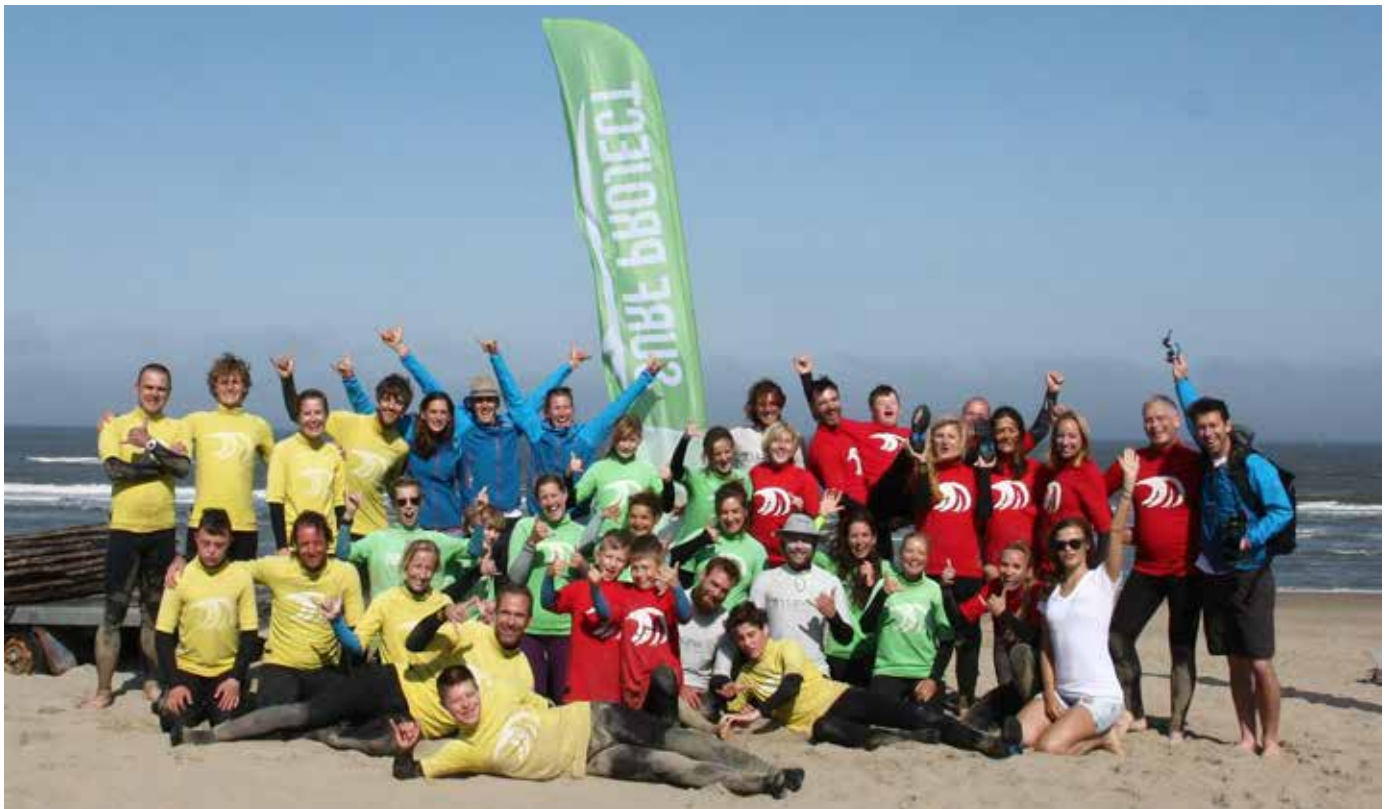
Het Surf Project

kerk, waarvan een deel onderdak bood aan de Villa, wordt gesloten. Villa Vrede is als dagopvang voor ongedocumenteerden in de Gemeente Utrecht een onmisbare plek. Kijkt u alstublieft uit of u ergens een geschikte ruimte weet. (Zie ook onder Iets voor u?)