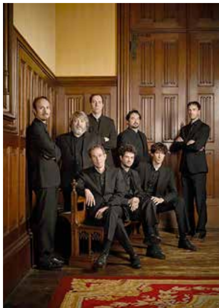
Cappella Pratensis op zondag 18 december

Zondag 4 december – 19.30 uur Bachcantatedienst J.S. Bach, cantate Wachet! betet! betet! wachet! (BWV 70) Info: www.bachcantates-utrecht.nl Vrijdag 16 december – 16.00 uur Kerstconcert Kamerkoor Decibelle: Veni Emmanuel Info: info@decibelle.net Zaterdag 17 december – 20.00 uur Vocaal Ensemble Vivavoce zingt de Messiah van G.F. Händel Info: www.vivavoce.nl Zondag 18 december – 20.00 uur Cappella Pratensis – Kerst met Josquin des Prez: Polyfonie rond de kribbe Info: www.oudemuziek.nl