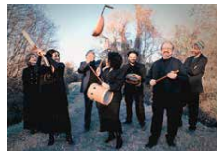
Ensemble Lucidarium musicert op donderdag 1 september