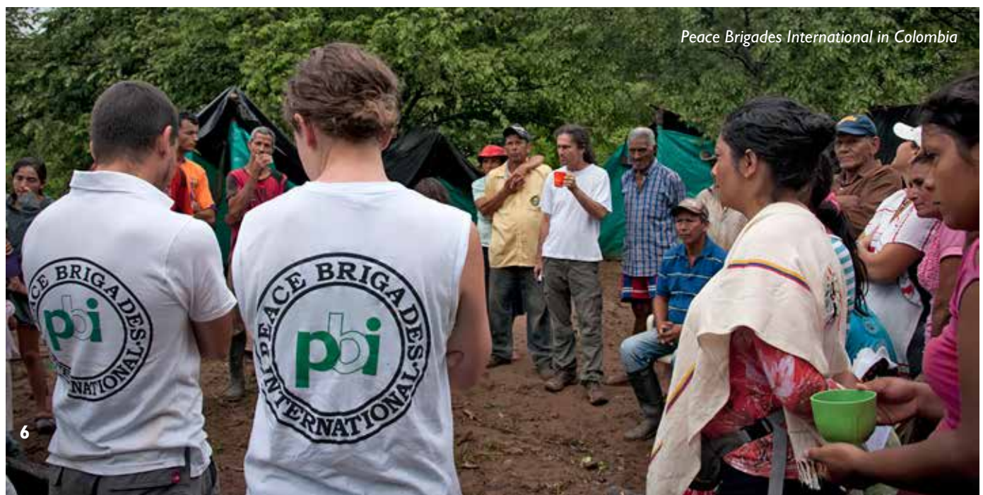
Peace Brigades International in Colombia