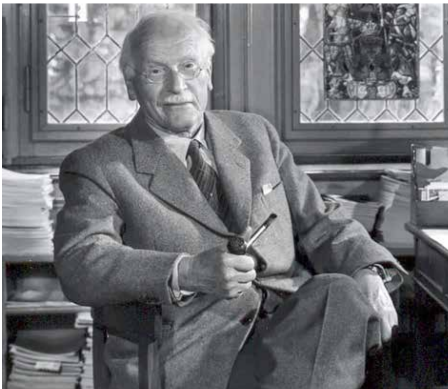
Carl Gustav Jung op 17 oktober

De volgende Geertebrief verschijnt op 4 november. Kopij inleveren op uiterlijk donderdag 20 oktober vóór 10 uur v.m.