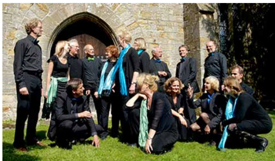
Trajecti Voces presenteert op 20 november 'Perezwony'