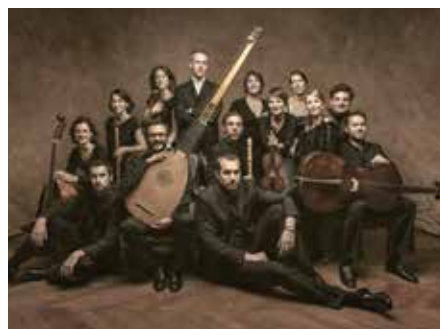
Ensemble Correspondances speelt Charpentier

Noël à Paris: Ensemble Correspondances speelt kerstmotetten van M.A. Charpentier Info: www.oudemuziek.nl