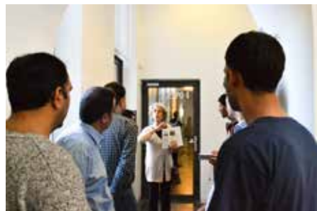
Centraal Museum, rondleiding voor Syrische vluchtelingen

Onlangs werd bekendgemaakt dat de kerken in Nederland de afgelopen maanden bijna € 1,8 miljoen hebben ingezameld voor vluchtelingen. Het is de vraag of bij dit bedrag ook de opbrengst van € 565,- van de RGU-collecte op 1 november is meegeteld. Onze opbrengst is naar Vluchtelingenwerk Midden-Nederland overgemaakt. Dat is een regionale afdeling van Vluchtelingenwerk Nederland; actief op achttien locaties, in zeven asielzoekerscentra en op één gezinslocatie in Utrecht, Flevoland en 't Gooi-Vechtstreek.